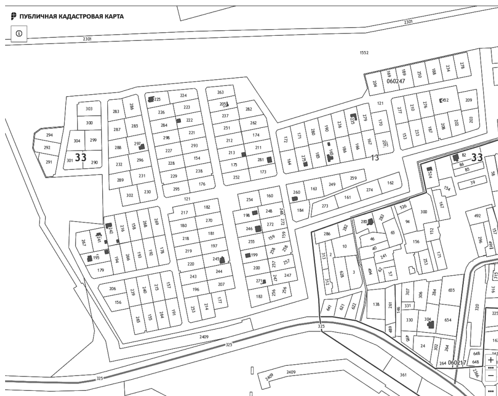
Схема расположения территории садоводческого некоммерческого товарищества «Волга» муниципальное образование «Нагорное сельское поселение» Петушинского муниципального района Владимирской области Российской Федерации

Комментарий: - территория «Волга» расположено в кадастровом квартале 33:13:060247