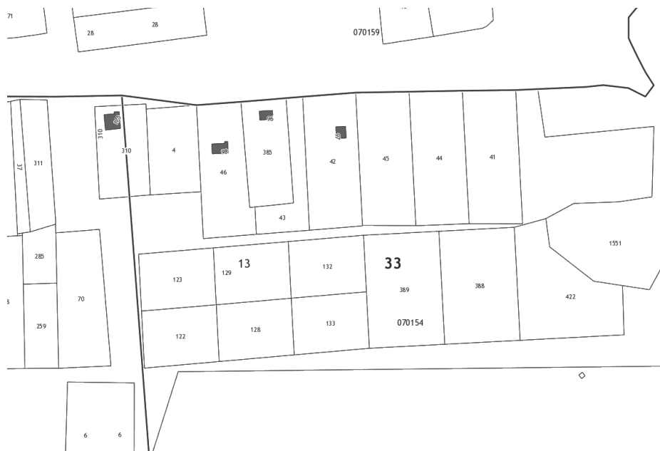
Схема расположения улиц «Солнечная» в п. Нагорный муниципальное образование «Нагорное сельское поселение» Петушинского муниципального района Владимирской области Российской Федерации

Приложение № 1 к решению Совета народных депутатов Нагорного сельского поселения от 30.05.2019 № 6/5.