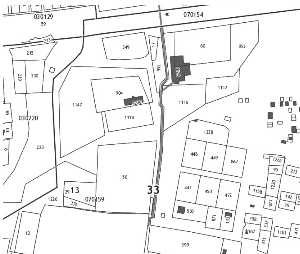
Схема расположения улицы «Производственная» в п. Нагорный муниципальное образование «Нагорное сельское поселение» Петушинского муниципального района Владимирской области Российской Федерации

Приложение № 2 к решению Совета народных депутатов Нагорного сельского поселения от 30.05.2019 № 6/5.