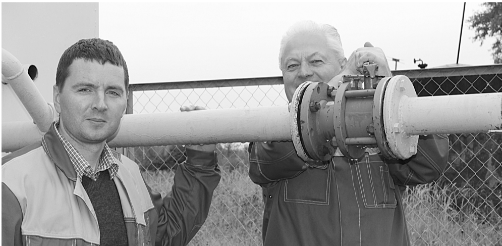
25 августа в п. Санинского ДОКа прошел День села,

23 августа состоялся пуск природного газа в многоэтажных домах п. Санинского ДОКа. Газификация выполнена по программе газификации населенных пунктов Нагорного сельского поселения Петушинского района, не вошедших в программу регионов РФ по Владимирской области на 2012 – 2015 годы.