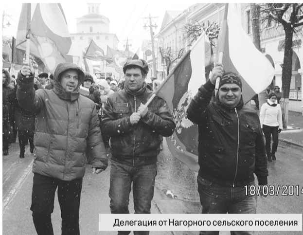
Делегация от Нагорного сельского поселения

О своей искренней поддержке решения жителей Крыма и Севастополя, об одобрении действий Президента России заявили государственные и муниципальные служащие, деятели культуры, представители трудовых коллективов молодёжных и общественных организаций, казачества и национальных диаспор, большинства региональных отделений политических партий.