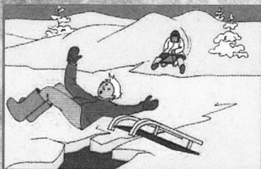
Внимание! В таких местах под снегом могут быть глубокие трещины и разломы.