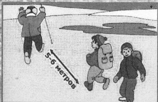
Опасно выходить на лед в одиночку!