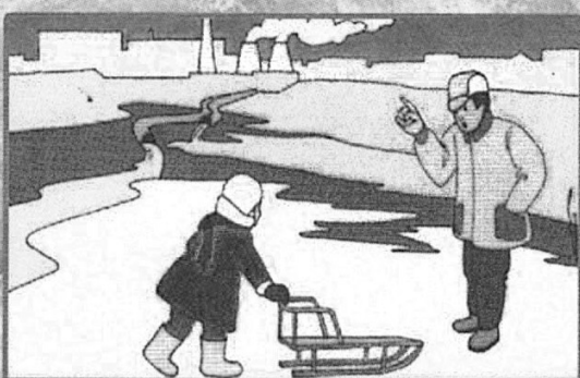
Осторожно! В этих местах даже в сильный мороз тонкий лед!