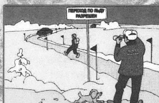
Помните! Быстрое оказание помощи попавшему в беду возможно только в зоне разрешенного перехода!