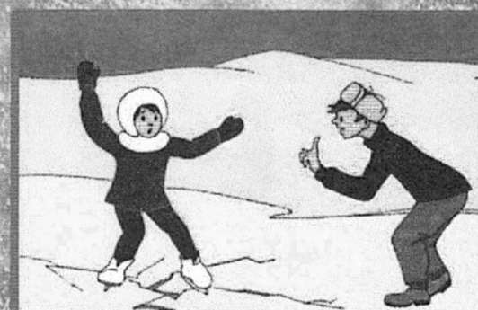
Если под вами затрещал лед и появились трещины не пугайтесь и не бегите от опасности! Плавно ложитесь на лед и перекачивайтесь в безопасное место!