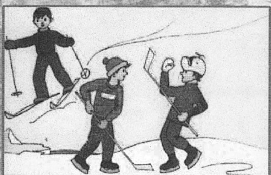
Будьте осторожны! Под снегом могут быть полыньи, трещины или лунки!