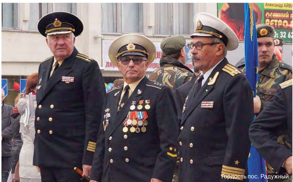
Гордость пос. Радужный

Владимирская область - один из древнейших историко-художественных центров русской земли. Территории, которые в неё входят, издавна составляли ядро Владимиро-Суздальского княжества, а с конца XVIII века - Владимирской губернии.