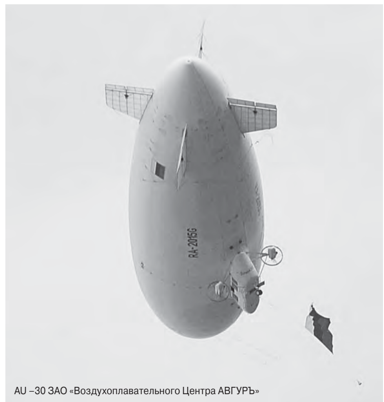
AU -30 ЗАО «Воздухоплавательного Центра АВГУРЬ»

Владимирская область имеет достаточно развитые внешнеэкономические связи. Ведущими экономическими партнёрами области являются Германия, Италия, Нидерланды, Украина, Индия, Узбекистан, Франция, Чехия, Молдова.