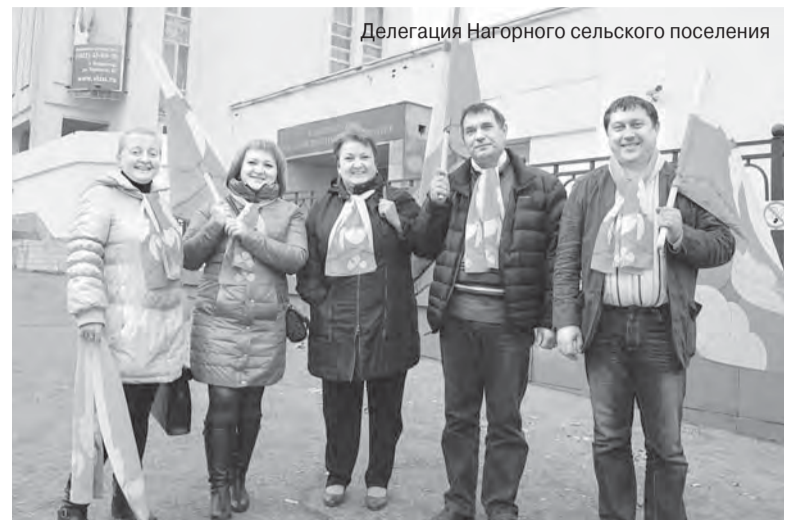
Делегация Нагорного сельского поселения