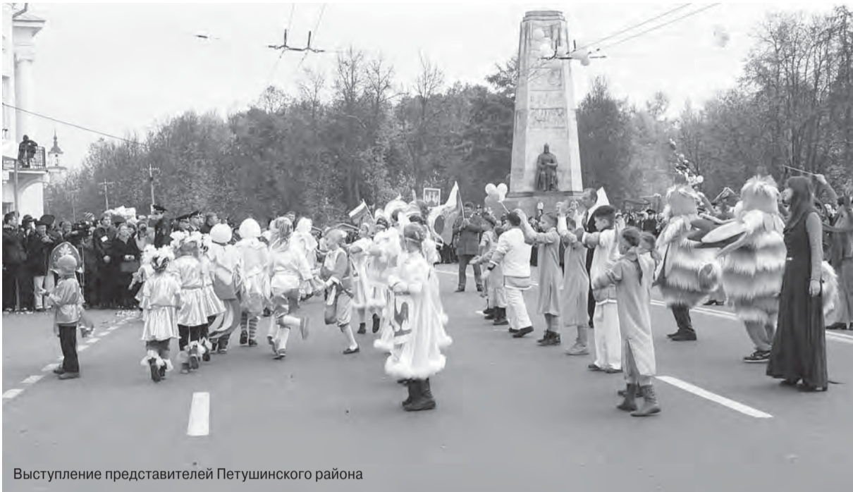
Выступление представителей Петушинского района

Подробный фоторепортаж с праздника смотрите на официальном сайте администрации Нагорного сельского поселения