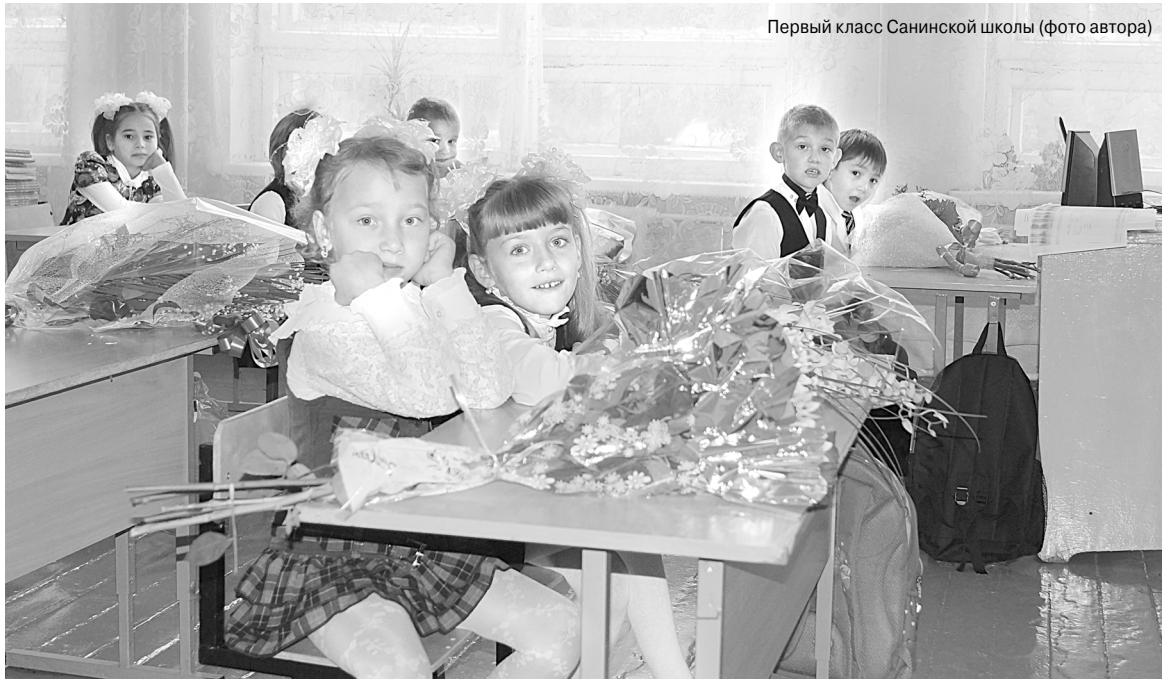
Первый класс Санинской школы

Вопрос: Какие новшества ждут родителей и учеников в новом учебном году?