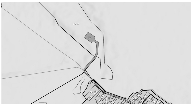
Схема расположения территории «Промзона № 1» сельское поселение Нагорное Петушинского муниципального района Владимирской области Российской Федерации

Приложение № 1 к решению Совета народных депутатов Нагорного сельского поселения от 26.08.2021 № 1/6