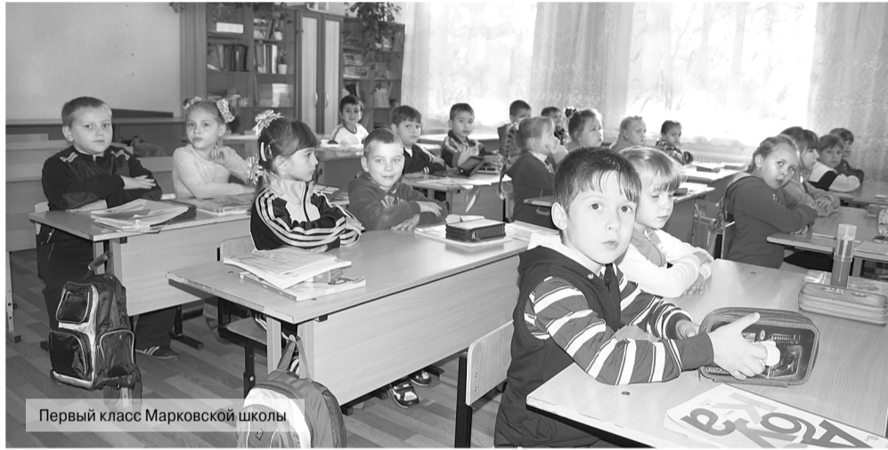
Первый класс Марковской школы

В следующем номере читайте о школе пос. Санино.