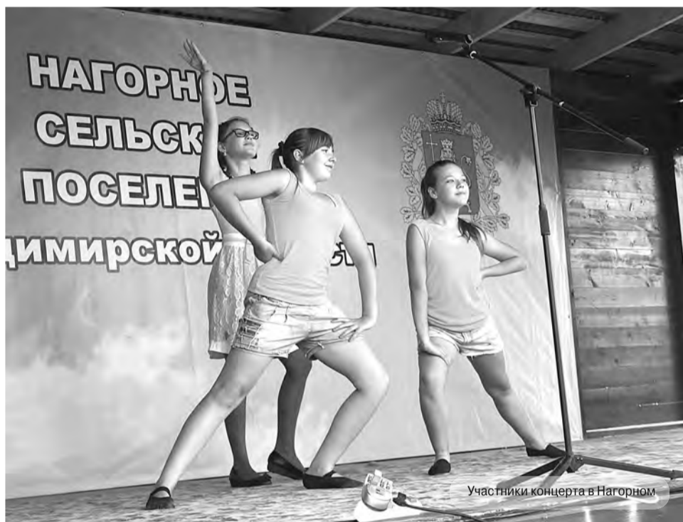
Участники концерта в Нагорном