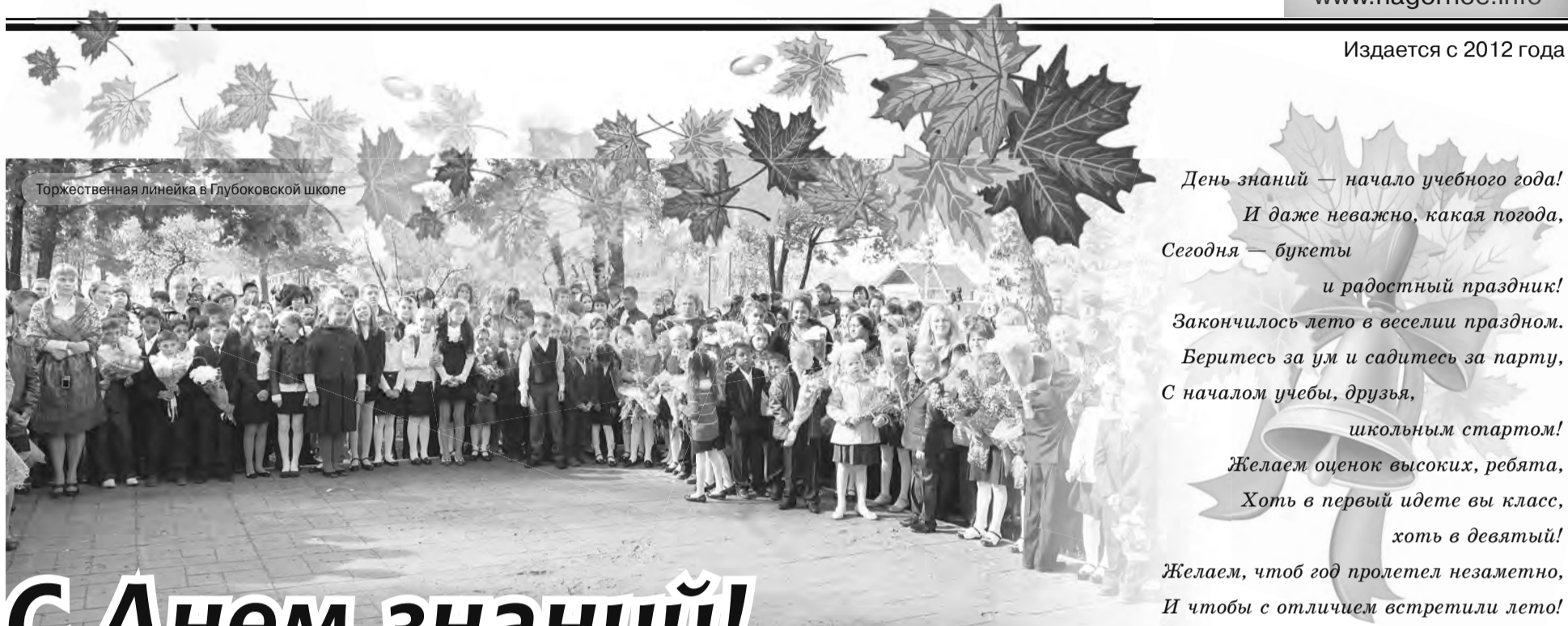
Торжественная линейка в Глубоковской школе

День знаний — начало учебного года! И даже неважно, какая погода, Сегодня — букеты и радостный праздник! Закончилось лето в веселии праздном. Беритесь за ум и садитесь за парту, С началом учебы, друзья, школьным стартом! Желаем оценок высоких, ребята, Хоть в первый идете вы класс, хоть в девятый! Желаем, чтоб год пролетел незаметно, И чтобы с отличием встретили лето!