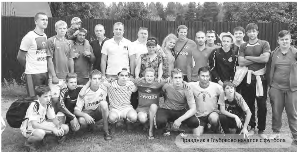
Праздник в Глубоково начался с футбола