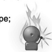
Позаботьтесь о пожарной безопасности своего дома сейчас.