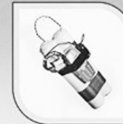
самодельное взрывное устройство