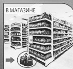
сообщить продавцу или охране магазина