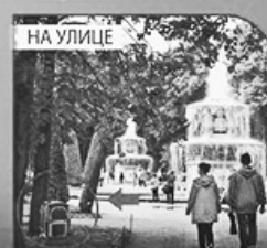
вызвать полицию или спасателей

ВАЖНО ЗНАТЬ: ИГИЛ – это одна из самых опасных террористических группировок. Вербует в свои ряды граждан со всего мира. Организация несёт угрозу государствам.