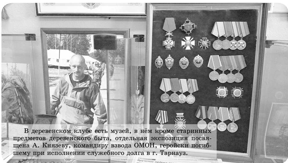
В деревенском клубе есть музей, в нём кроме старинных предметов деревенского быта, отдельная экспозиция посвящена А. Князеву, командиру взвода ОМОН, героически погибшему при исполнении служебного долга в г. Тарнауз.