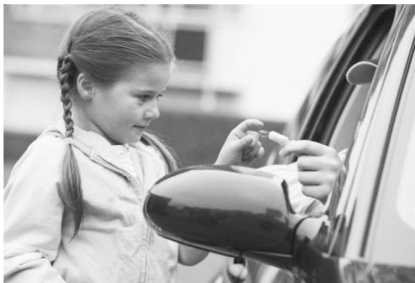
«Билайн» - 002.

Вызвать полицию со стационарного телефона можно, набрав номер «02», с мобильного «Теле - 2» - 002, «МТС» - 020, «Мегафон» - 020,