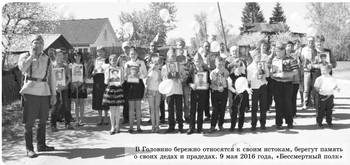
В Головино бережно относятся к своим истокам, берегут память о своих дедах и прадедах. 9 мая 2016 года, «Бессмертный полк»