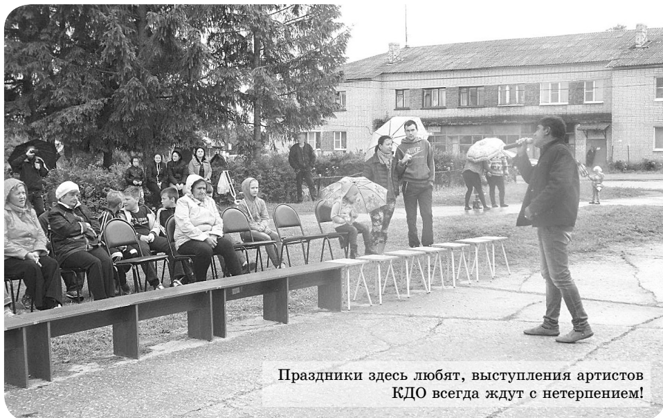
Праздники здесь любят, выступления артистов КДО всегда ждут с нетерпением!