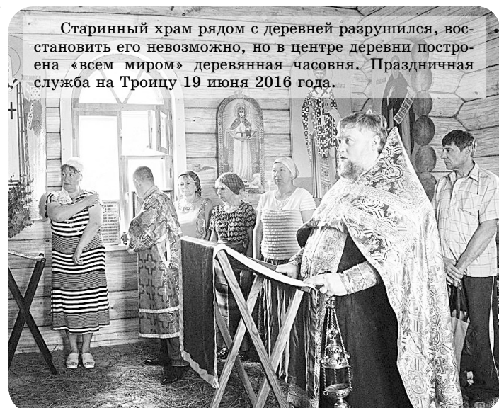
Старинный храм рядом с деревней разрушился, восстановить его невозможно, но в центре деревни построена «всемирно» деревянная часовня. Праздничная служба на Троицу 19 июня 2016 года.